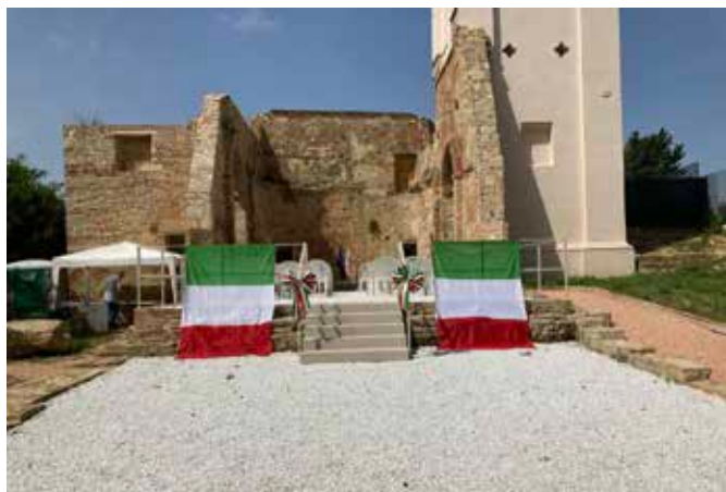
Foto 1: La chiesa Vecchia e il campanile recentemente ristrutturati addobbati per la celebrazione