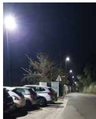
Figura 1: Via Querciole