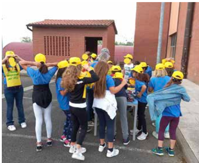
Foto 2: i bambini della classe V si preparano per una passeggiata lungo le strade di Fauglia per la raccolta dei rifiuti abbandonati.