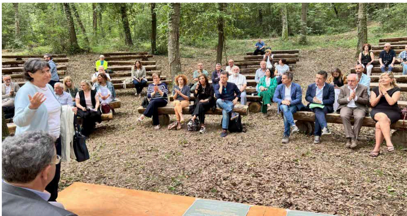
Foto 1: Vice presidente regionale Saccardi, Sindaci, amministratori e presidenti associazioni di categoria, presso Lago Alberti di Guasticce.