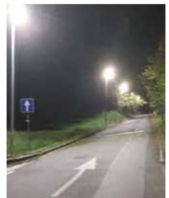
Figura 2: Via 8 Marzo