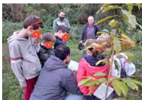
Foto 4: piantumazione dei Castagni e lettura del libro "L'Albero" di Silverstein