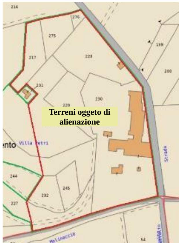
Fig. 1 – Identificazione dei beni da alienare.